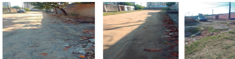
Fotos atuais da Rua 12, quadra 37, Antares 1.

A presente indicação tem por objetivo melhorar a qualidade de vida dos moradores, que sofrem, principalmente, em dias chuvosos.