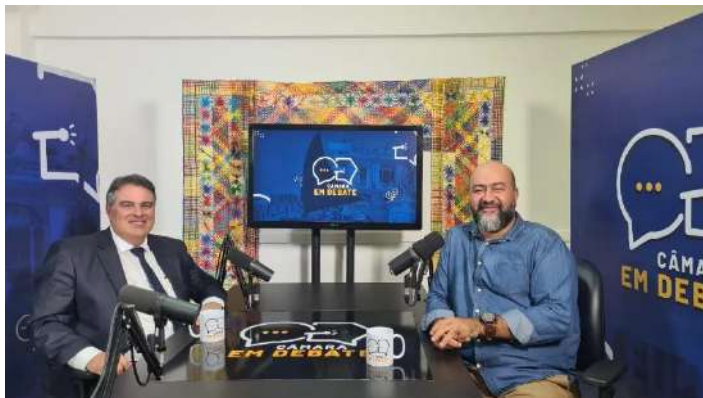
Participação Podcast Câmara em Debate