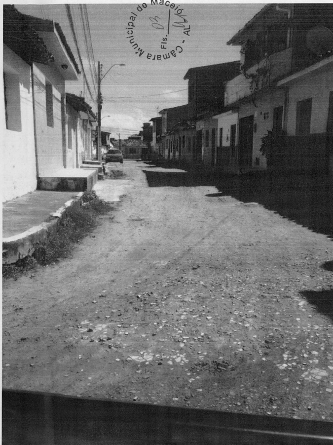
Rua Santa Teresina - Versel