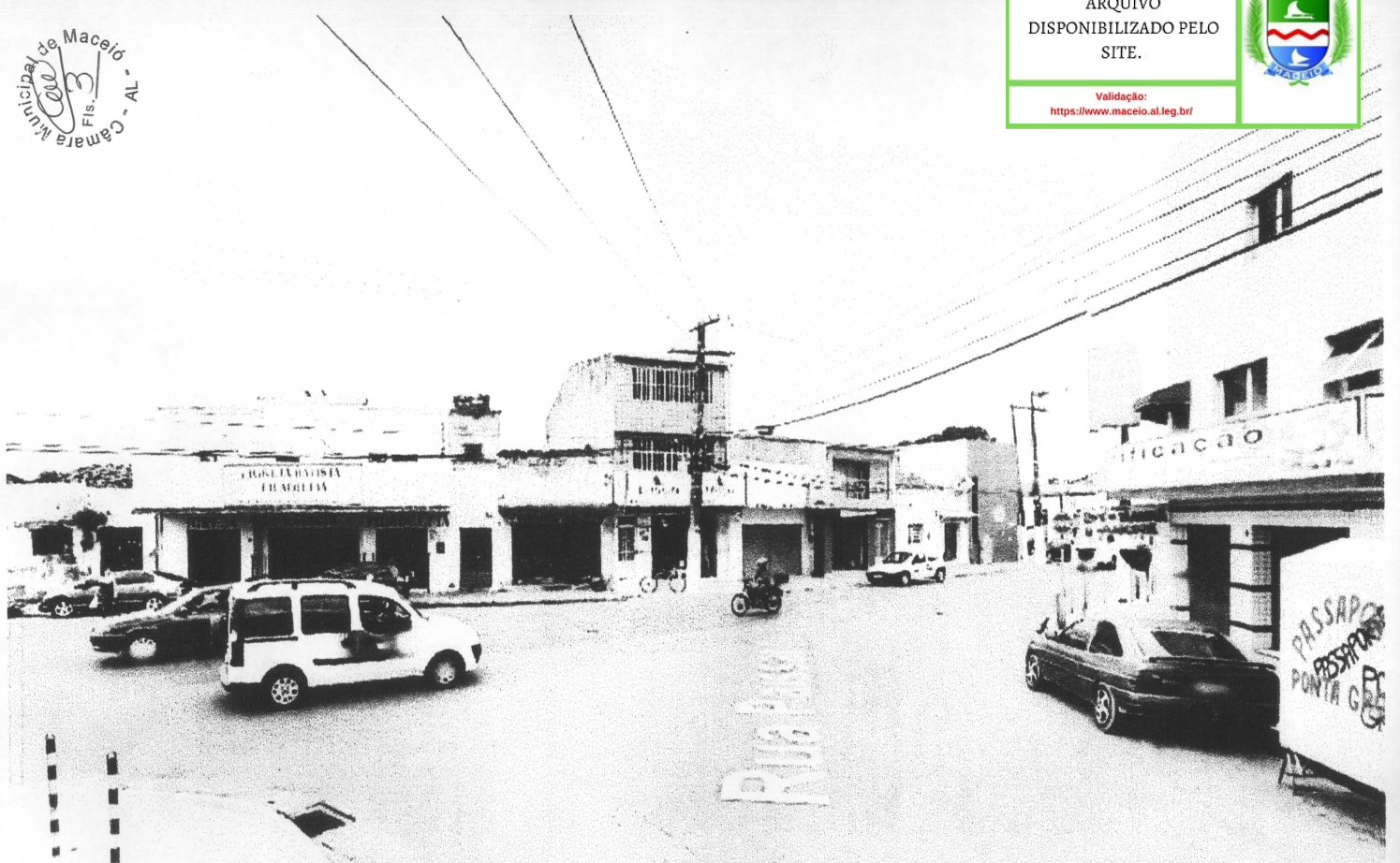
Cruzamento da Rua Payssanduú e/ a Rua Santo Antonio - P. grossa