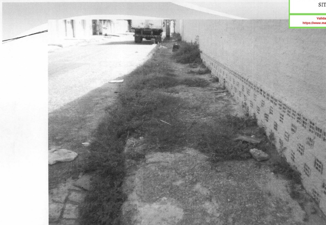
RUA DOIS DE JULHO - PONTA GROSSA